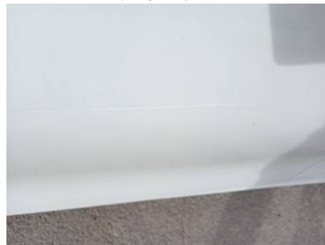
Porte avant droite (Rayure)