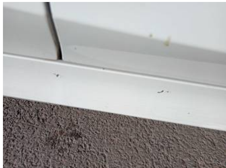
Bas de caisse droite (Rayure)