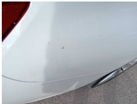
Aile arrière droite (Rayure)