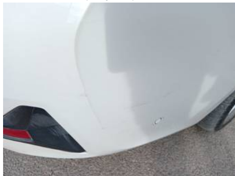
Bouclier arrière (Rayure)