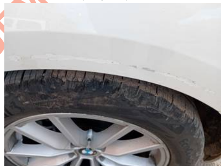
Aile arrière gauche (Rayure)