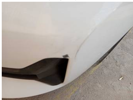
Bouclier avant (Rayure)